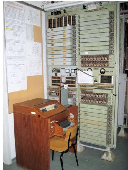
Blick in den technischen Betriebsraum

Den wesentlichen Teil unserer Sammlungen bilden die Einrichtungen der elektromechanischen Vermittlungstechnik sowie der TF- bzw. PCM-Übertragungstechnik.